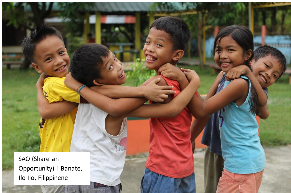
SAO (Share an Opportunity) i Banate, Ilo Ilo, Filippinene