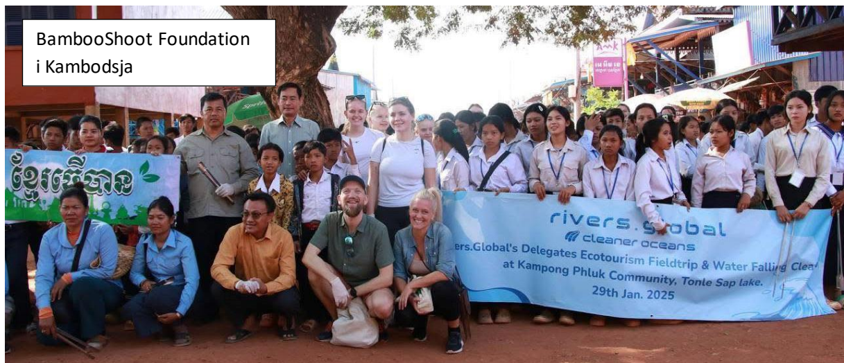
Bambooshoot Foundation i Kambodsja