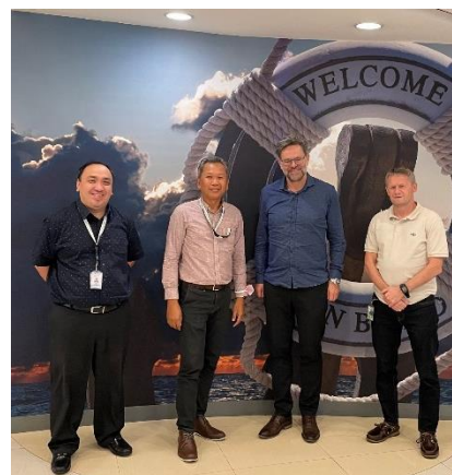
Til høyre: Møte med Norwegian Training Center som utfordret oss på å få bygget en oppsamler i Manila innen oktober.