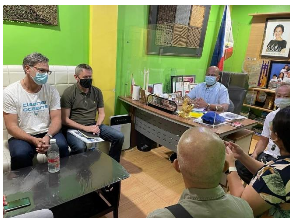
Til venstre: Møte med ordføreren i Bagbag.